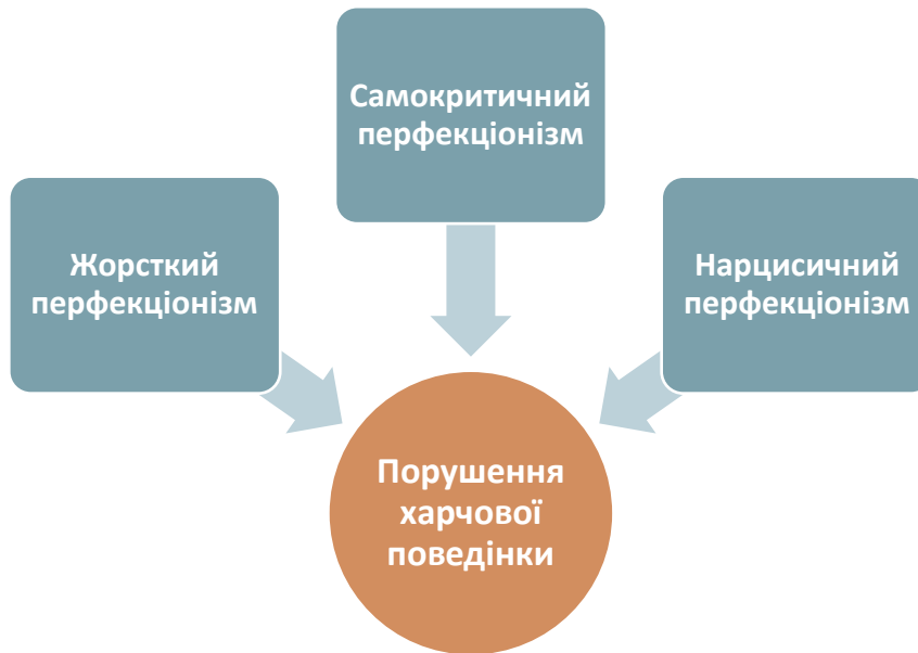
Рис. 2.2. Типи перфекціонізму як предиктори порушень харчової поведінки